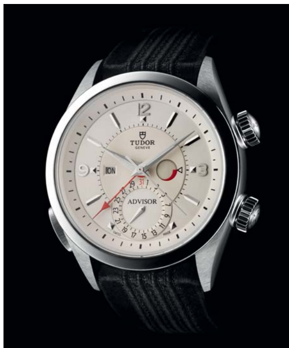
TUDOR HERITAGE ADVISOR