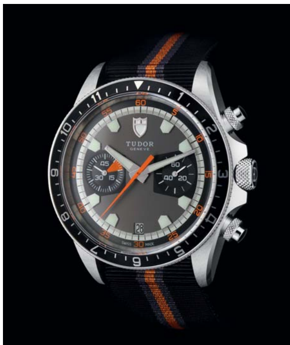
TUDOR HERITAGE CHRONO

Una multitud de pequeños detalles le dan al reloj su nuevo y muy contemporáneo aspecto. Entre ellos se encuentran las delicadas muescas en el bisel giratorio y la gran corona de 8mm decorada con el emblema Tudor Rose. El muy particular color burdeos oscuro de su bisel proviene de los archivos de la marca, inspirado en un reloj de principios de los años 80. Su encanto de época se ve reforzado por algunas sutiles diferencias - un magistral "envejecimiento", como de chocolate espolvoreado en la esfera de color negro o escala en oro que tiende a bronce, o incluso el oro rosa que incluye a los marcadores de